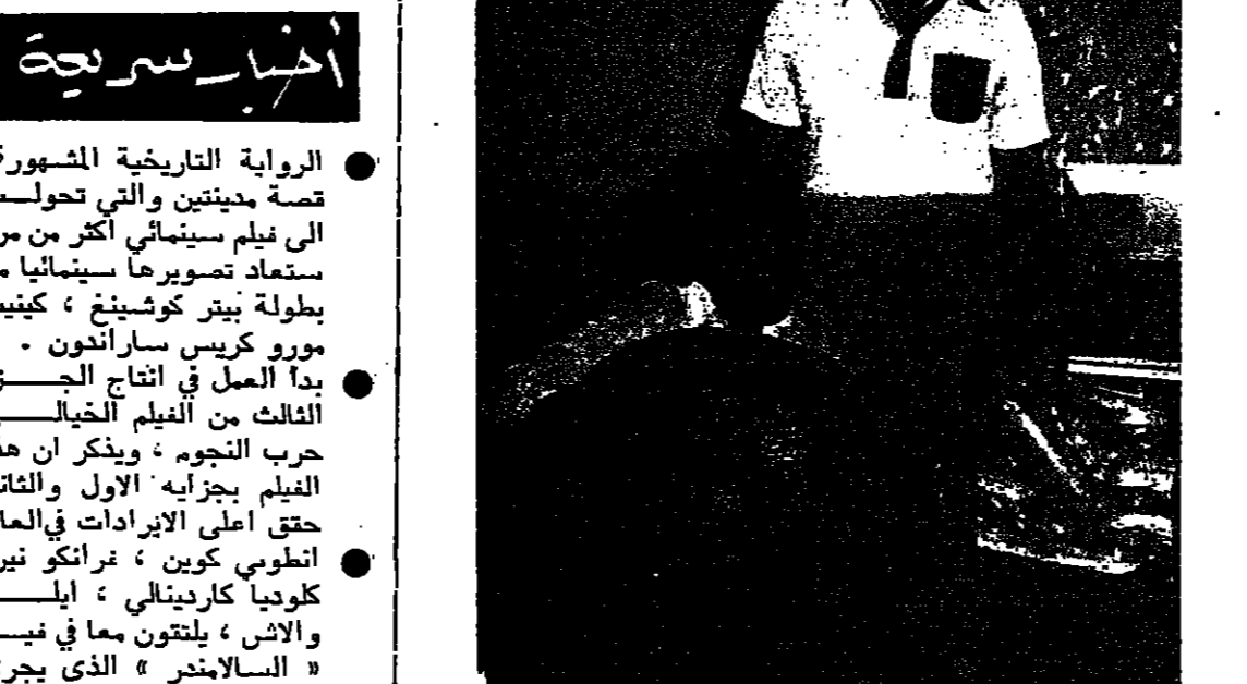
المطرب فؤاد فرو مع الفنان ابراهيم درويبي - عسيفا

وتبيناتنا بالتونيق . اما فؤاد فرو فهو حنجر تصانبة نقية ، تخرج الالاحان منها كما يجب ان تكون ، سليمة لا يشوبها اي نشاز . اللون الذي يغنيه فؤاد هو لون غناء فريد الاطرش ولكنه يقول : الا ان هذا لا يمنعني من ان اغني الاغاني الشعبية المألوفة كلالاغتي